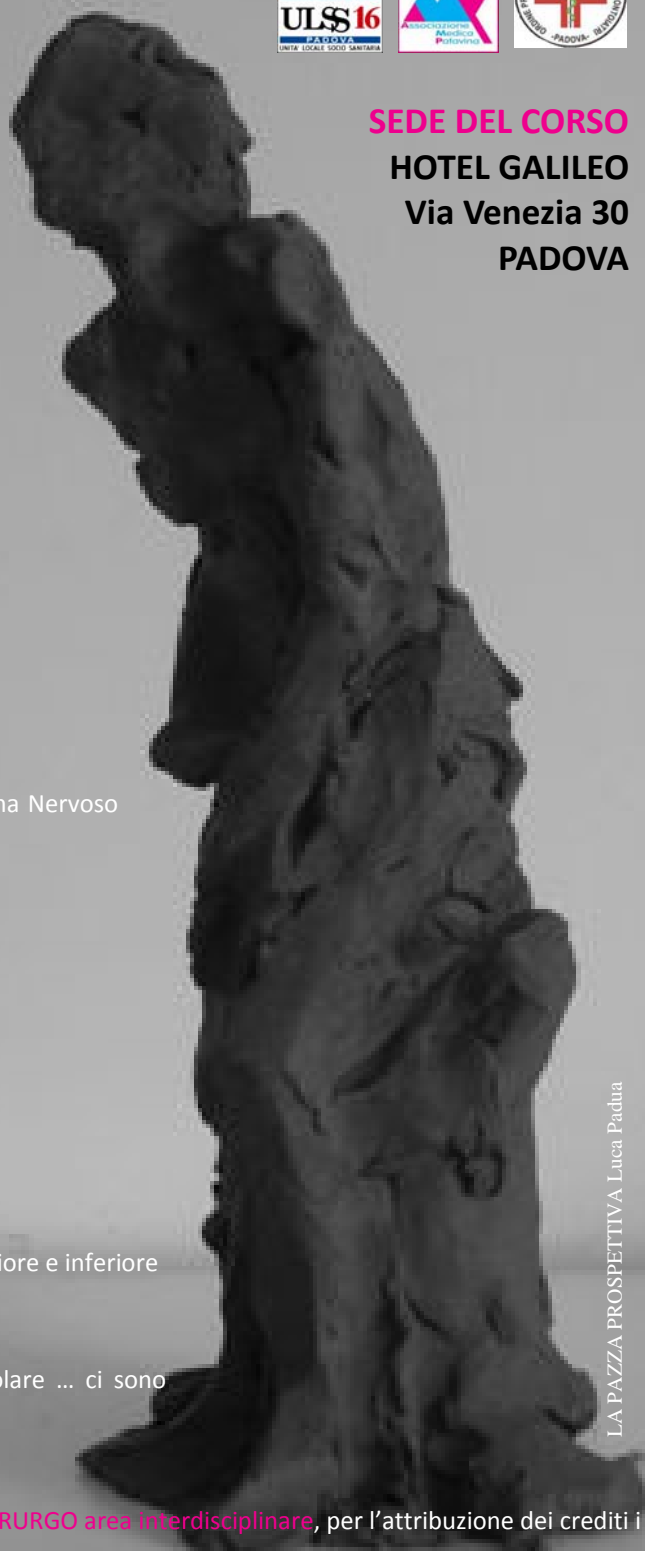
LA PAZZA PROSPETTIVA Luca Padua